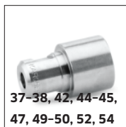
37-38, 42, 44-45, 47, 49-50, 52, 54