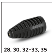
28, 30, 32-33, 35