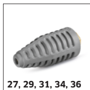
27, 29, 31, 34, 36