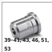
39-41, 43, 46, 51, 53