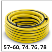
57-60, 74, 76, 78