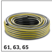
61, 63, 65