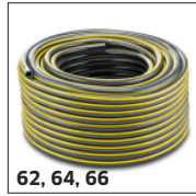
62, 64, 66