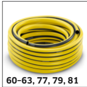
60-63, 77, 79, 81