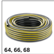
64, 66, 68